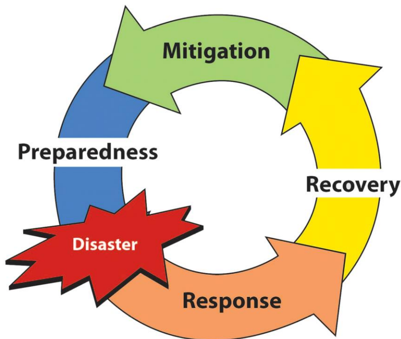
Fig 2 Les quatre étapes fondamentales de la préparation aux catastrophes

La préparation aux catastrophes comprend quatre étapes fondamentales : l'atténuation, la préparation, l'intervention et la reprise.